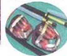
透明のプロテクターがついた盾と空気を入れて使うエアソフト剣