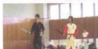
基本動作を学ぶ本場さながらの本場動作の練習